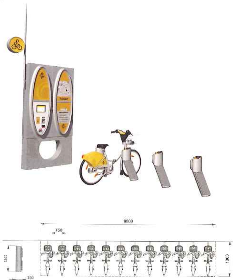
Exemple de configuration pour 12 vélos