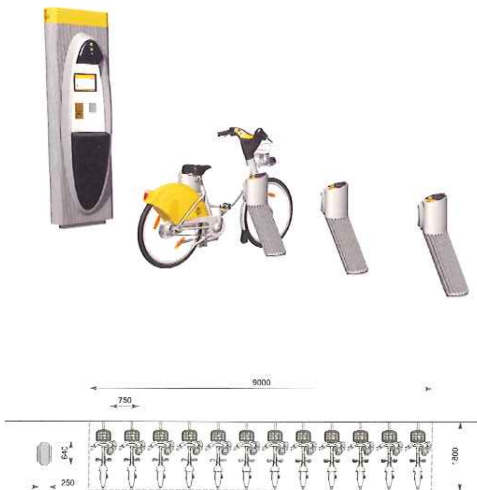
Exemple de configuration pour 12 vélos