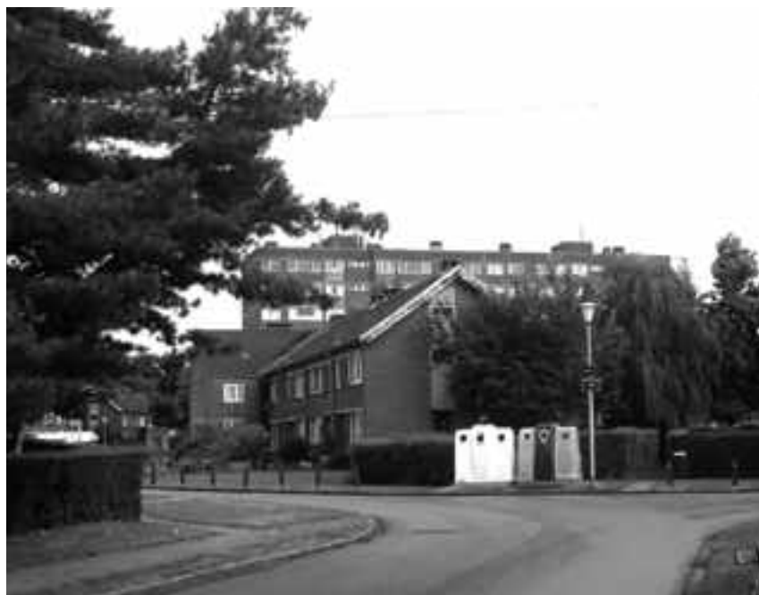
La cité du Melkriek, point de départ de l'itinéraire N°5.