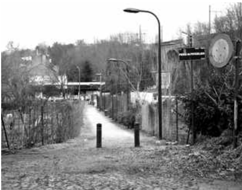
Chemin du Sparrenweg longeant la déchetterie et débouchant rue de Stalle.

Près de l'entrée de l'athénée se trouve un parking. Dans un coin de celui-ci démarre un escalier suivi d'un petit sentier secret, étroit, bordé de végétation et de palissades en bois. Il mène au clos de l'Abbé Froidure. Sortir du Clos et traverser la rue E. Van Ophem. Suivre sur la droite, la rue P. De Puyselaere. Le home Brugmann se trouve à proximité, au coin de la rue E. Van Ophem et du Cauter. Prendre ensuite à