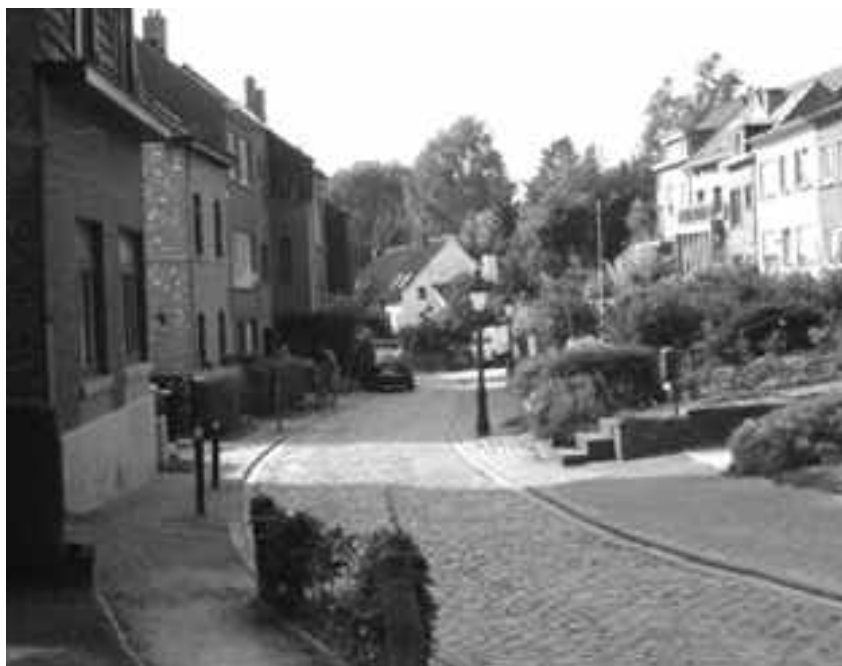
La rue de Linkebeek... Une des premières rues mises en « zones 30 » à Uccle.

L'itinéraire passe sous le petit pont du chemin de fer et rejoint la rue de Linkebeek. C'est une ancienne voirie typique, très étroite, parfois sans trottoir. Les différents projets aux alentours (parkings RER de 200 places, constructions diverses) font craindre à ses habitants de perdre la quiétude et la qualité de vie qu'ils connaissent à présent. C'est pourquoi, ils demandent depuis longtemps la mise en impasse de leur rue sous ce pont du chemin de fer. Cette solution aurait pour effet d'enfin sécuriser