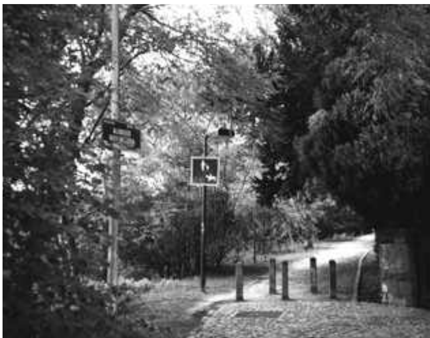
Chemin des Sophoras, coupé à la circulation automobile.

Ce chemin permet d'atteindre l'avenue des Tilleuls. Prendre à gauche et passer sur les ponts du chemin de fer. Au bout de l'avenue, remarquez le superbe panorama sur Bruxelles. Traversez la rue du Bourdon, tournez à droite le long du cimetière de Saint-Gilles jusqu'au chemin revêtu en dur (dalles) qui descend à gauche : le « Linthoutweg ». Cette ancienne artère autrefois à circulation très dense est déjà