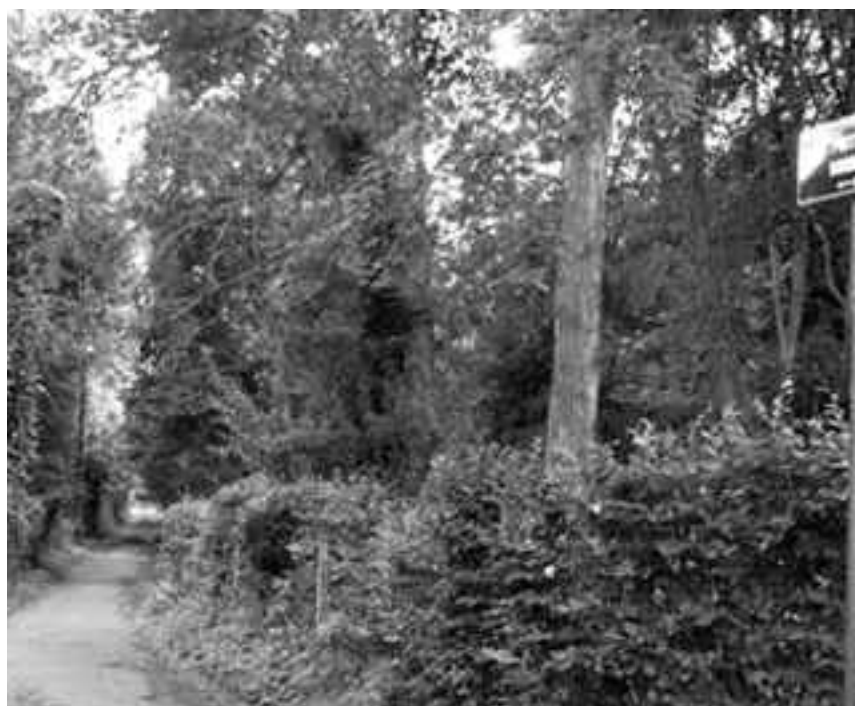
Chemin du Puits.

Le carrefour suivant s'ouvre sur la rue de Verrewinkel, à sens unique et pavée. Le trottoir de droite est inexistant sur quelques mètres, il vaut donc mieux utiliser celui de gauche. Nous remontons donc la rue de Verrewinkel sur la gauche pour atteindre le Lycée Français, but de notre itinéraire. Quelques dizaines de mètres plus haut, la rue atteint la ligne de chemin de fer n°26. À cet endroit devrait se situer la future halte Verrewinkel / Lycée Français qui serait fort utile dans ce quartier peu desservi en transports publics.