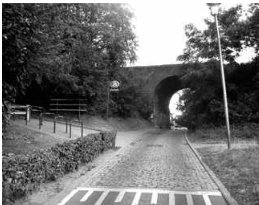
Chemin reliant la gare du Moensberg à la rue de Linkebeek.

Notre itinéraire descend l'avenue d'Homborchveld directement sur