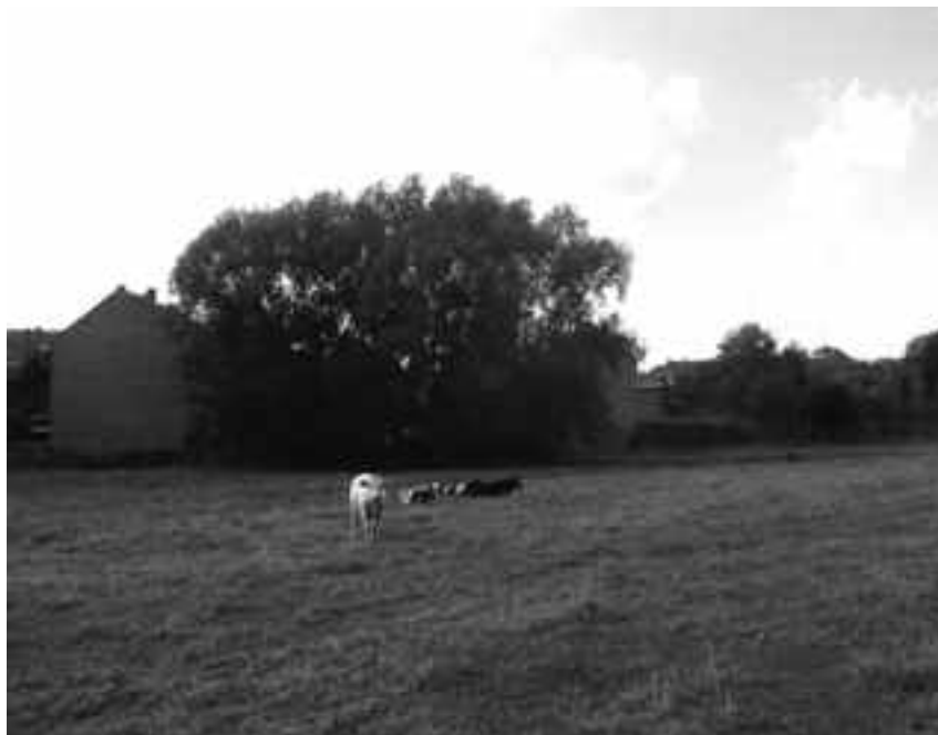
Prairie empruntée par l'itinéraire N° 1 pour relier la Grootte Baan à la rue des trois Rois. Un sentier doit y être créé pour pérenniser et compléter l'itinéraire.

Ensuite, la rue des Trois Rois retrouve son aspect de chemin destiné aux piétons, des blocs de bois la ferment à la circulation, même les cyclistes mettent pied à terre. Sans doute pour dissuader les engins motorisés bruyants qui dérangeront certainement les habitants des maisons longées.