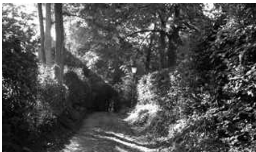
Rue du Château d'Eau. Cette partie pavée et classée du chemin est restée dans un état très proche de celui représenté sur les cartes postales d'il y a plus d'un siècle.