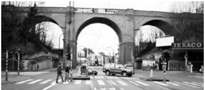
Rue de Stalle, terminus de notre itinéraire et nœud intermodal important.