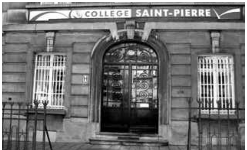
Entrée du Collège St Pierre, section secondaire, avenue Coghén.

* E. Danco (1869-1898), brillant officier de l'école militaire et de l'école d'application. Participe à la célèbre expédition de la Belgica de Gerlache en Antarctique. Danco y était chargé des observations relatives à la physique du Globe. Rappelons qu'outre cette place à Uccle, une grande terre qui borde l'est du détroit de la Belgica s'appelle Terre de Danco.