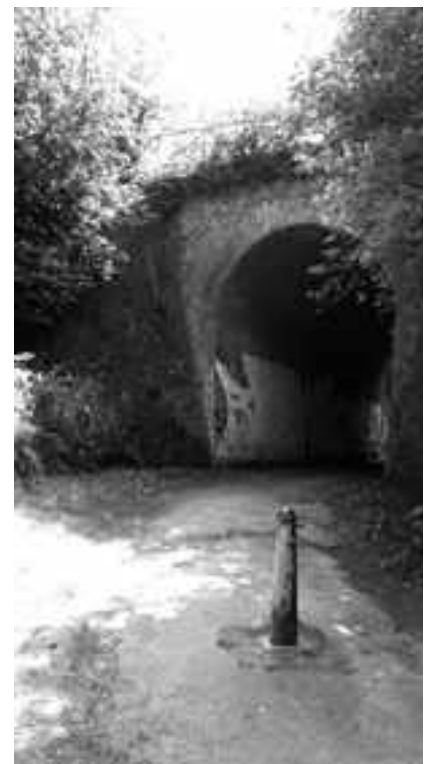
Le passage du chemin du Puits sous la voie de chemin de fer permet de déboucher depuis le plateau vers la réserve naturelle du Kinsendaël.

Chemin du Puits : le revêtement d'une partie du chemin du Puits, terre recouverte d'asphalte, est très dégradé. La Région va certainement proposer prochainement l'aménagement de la promenade verte « piétons et cyclistes » qui passe par ce chemin du Puits. Si les plans du futur lotissement Engeland voient le jour, tels que présentés à l'enquête publique, la voirie principale du lotissement couperait la promenade verte et une sécurisation du passage piétons et cyclistes, à cet endroit, devrait alors être envisagée. Rappelons aussi qu'il convient de préserver l'aspect paysager du chemin du Puits et de la rue Engeland à typologie rurale.