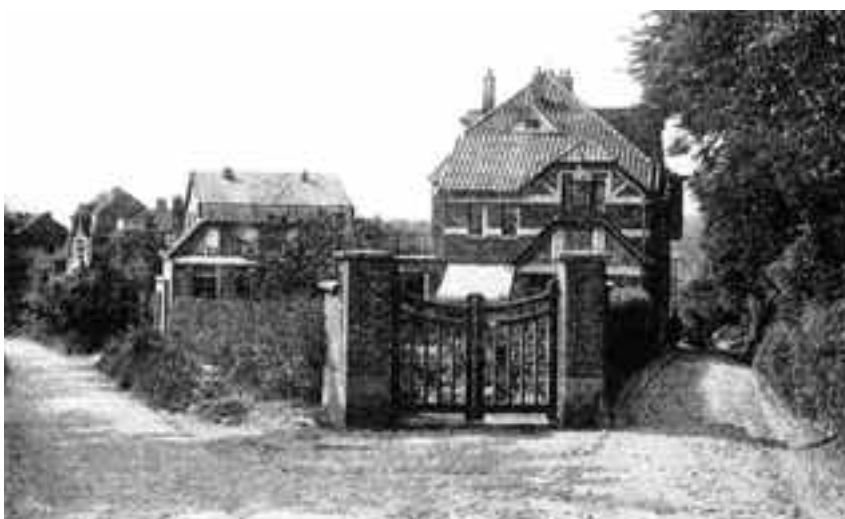
29. Uccle - Rue du Château d'Eau et rue des Moines - Ukkel - Wauwatenstraat en Schippenmaat