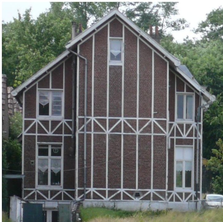
ci-dessus : Maison du concierge, état actuel, façade tournée vers la rue Egide van Ophem

Notons que les abords de la rue van Ophem (quartier Calevoet-Stalle), au contraire du reste de la commune d'Uccle, s'étaient développés en un quartier industriel mixte (habitats ouvriers et industries) et non pas résidentiel bourgeois. L'implantation d'une infrastructure scolaire en ce quartier à caractère plutôt laborieux, pour le compte d'un organisme caritatif, n'est sans doute pas le fruit du hasard.