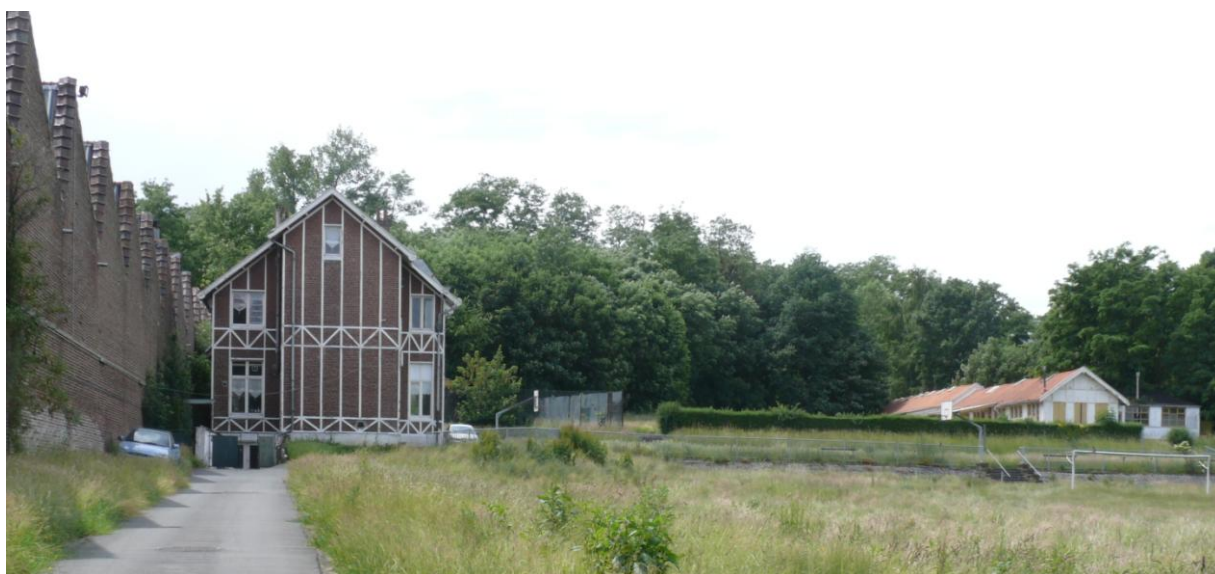
Ci-dessus : vue de l'ancien complexe scolaire depuis la rue Egide van Ophem. On distingue à gauche l'immeuble industriel mitoyen des anciennes usines « Bayot » (1930).

Aujourd'hui l'immeuble est menacé: Les nouveaux propriétaires (BPI) et leurs architectes (A2RC) projettent de lotir l'ancien terrain de sport et de jeu attenant. Pourtant le pavillon scolaire et son préau n'occupent qu'un infime pourcentage de la totalité du terrain. Ainsi la conservation des édifices historiques ne peut-elle nuire fondamentalement à l'investissement escompté. Leur aspect pittoresque et leur valeur historique ne sera d'ailleurs que bénéfique pour donner au futur quartier en cours d'urbanisation l'âme, l'identité et la saveur qui sinon risquerait de lui manquer cruellement.