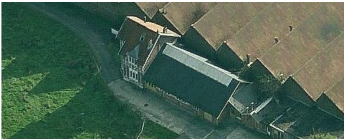
Ci-dessus : vue aérienne actuelle du complexe scolaire de 1912 en mitoyenneté avec le complexe industriel de 1930.